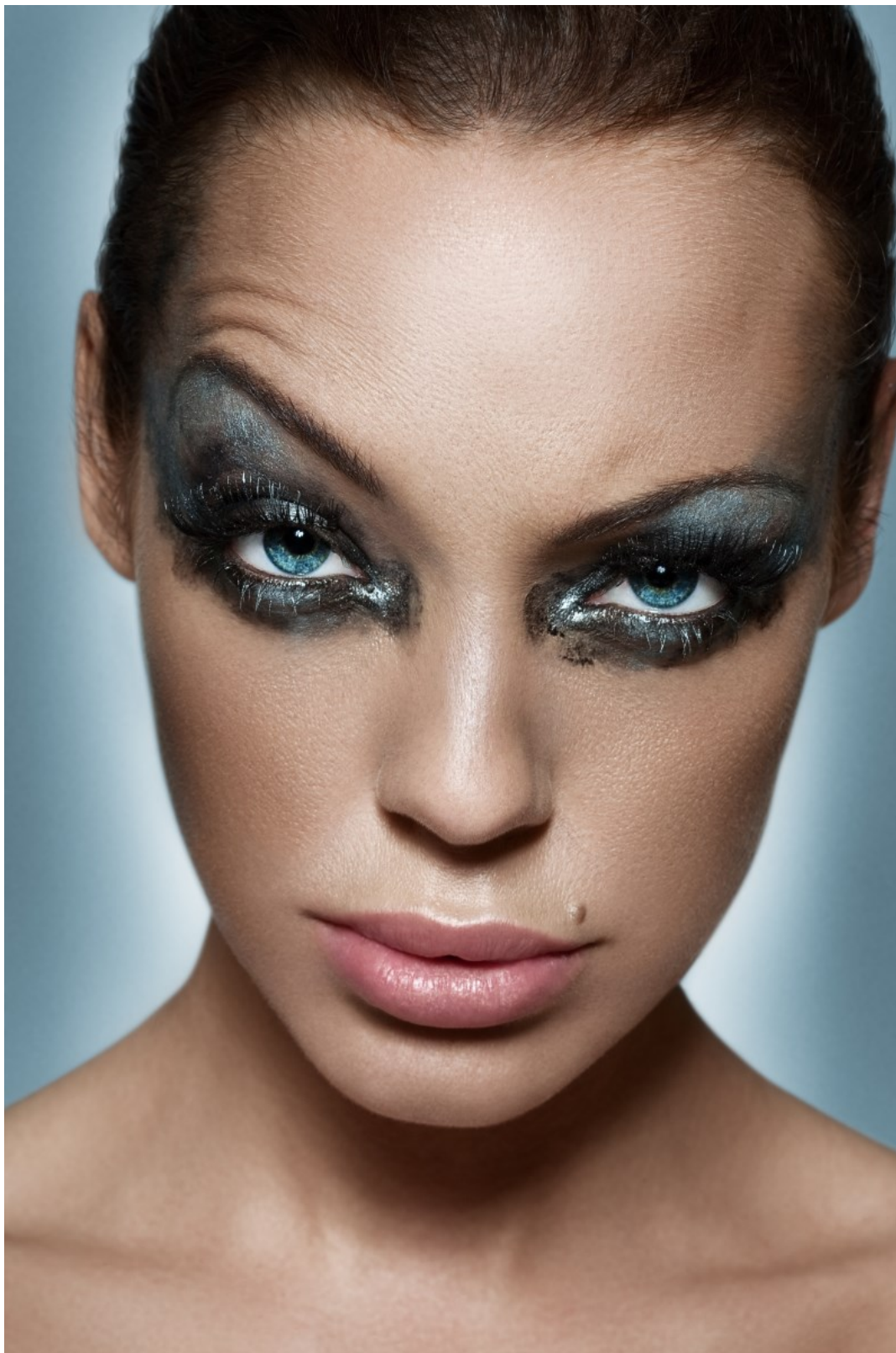
Model: Dorien Rose Duinker Visagie: Georgina Hoppen