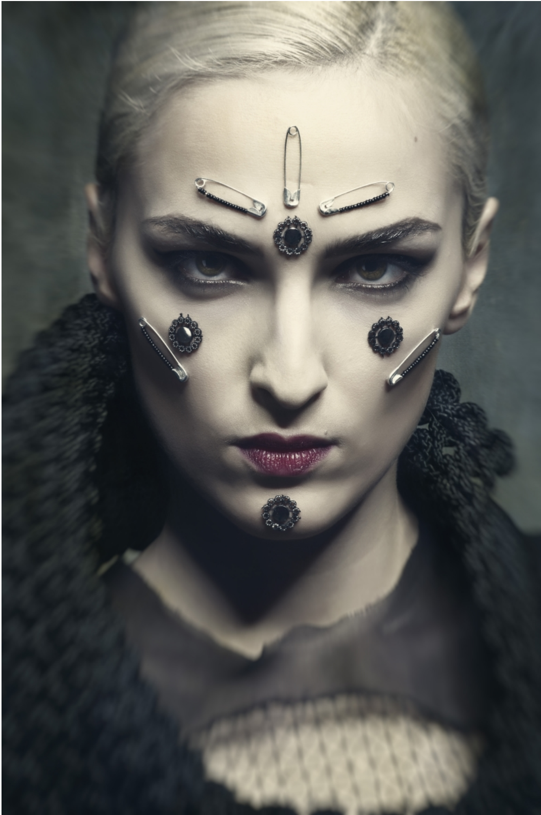
Modellen: Mandy van Damme MUAH: Lieke Wolfs - Styling: Joanne Maalderink Kleding: Floor Bras